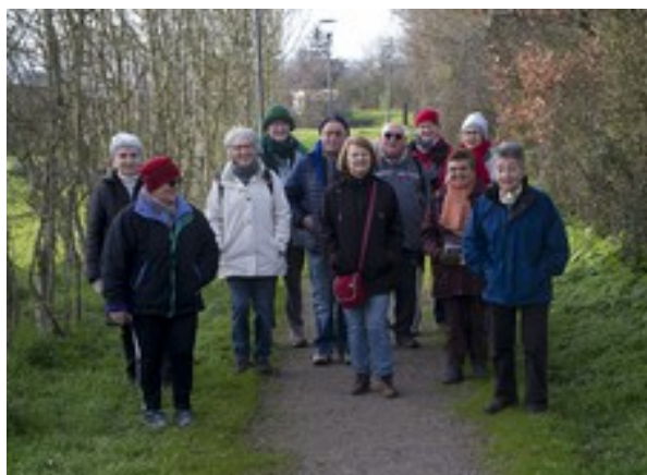
Leçon de botanique au détour d'un chemin.

sentier très agréable et nous aboutissons à la fin de la Rue Pont à Mousson. Là, hésitation, ce n'est pas très bien expliqué et pour cause depuis l'impression de ces documents, il y a eu beaucoup d'améliorations, mais nous trouvons un joli chemin débouchant dans un parc, puis à l'étang du Bois Regnier. Nous retrouvons notre point de départ heureux de cette balade vivifiante. Notre ville s'est présentée sous un jour très favorable. Nous avons quand même parcouru 7 km. Ah ! Quel bienfait.