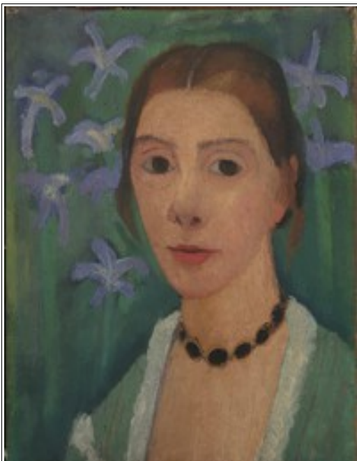
Autoportrait de Paula Modersohn-Becker

Paula Modersohn-Becker , née le 8 février 1876 à Dresde et morte le 21 novembre 1907 à Worpswede, est une artiste peintre allemande et l'une des représentantes les plus précoces du mouvement expressionniste dans son pays.